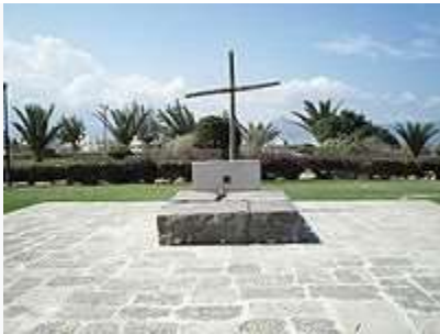
Φωτογραφία από τον τάφο του Καζαντζάκη.

Ο «Ζορμπάς» του Καζαντζάκη, εκδόθηκε στο Παρίσι το 1947 και με την επανέκδοση του, το 1954, βραβεύτηκε ως το καλύτερο ξένο βιβλίο της χρονιάς. Το 1955, ο συγγραφέας μαζί με τον Κακριδή αυτοχρηματοδότησαν την έκδοση της μετάφρασης της Ιλιάδας, ενώ την ίδια χρονιά κυκλοφόρησε τελικά στην Ελλάδα ο Τελευταίος Πειρασμός. Τον επόμενο χρόνο, τιμήθηκε με το Κρατικό Βραβείο Θεάτρου στην Αθήνα για τους τρεις τόμους Θέατρο Α΄, Β΄, Γ΄ και με το Παγκόσμιο Βραβείο Ειρήνης στη Βιέννη, ένα βραβείο το οποίο προερχόταν από το σύνολο των τότε Σοσιαλιστικών χωρών. Καθώς μια από αυτές ήταν η Κίνα επιχείρησε δεύτερο ταξίδι εκεί τον Ιούνιο του 1957, προσκεκλημένος της κινεζικής κυβέρνησης. Επέστρεψε με κλονισμένη την υγεία του προσβληθείς από λευχαιμία. Νοσηλεύτηκε στην Κοπεγχάγη της Δανίας και το Φράιμπουργκ (Freiburg im Breisgau) της Γερμανίας, όπου τελικά κατέληξε στις 26 Οκτωβρίου 1957 σε ηλικία 74 ετών. Εντούτοις, σύμφωνα με άλλες μαρτυρίες, η λευχαιμία εμφανίστηκε στον Καζαντζάκη κατά το χειμώνα του 1938, 19 χρόνια πριν απ' το τέλος του, το οποίο αποδίδεται σε βαριάς μορφής ασιατική γρίπη.[σ 1]