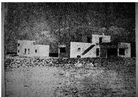
Το σπίτι του συγγραφέα (δεξιά) στην Αίγινα , φωτογραφημένο τον Αύγουστο του 1937.

Τον Απρίλιο, ο Καζαντζάκης, ξαναβρέθηκε στη Ρωσία, όπου γράφει ένα κινηματογραφικό σενάριο για το ρωσικό κινηματογράφο με θέμα από τη Ελληνική Επανάσταση του 1821, Το Κόκκινο Μαντήλι.[12] Τον Μάιο του 1929 απομονώθηκε σε ένα αγρόκτημα στην Τσεχοσλοβακία, όπου ολοκλήρωσε στα Γαλλικά τα μυθιστορήματα Τόντα-Ράμπα (Toda-Raba, μετονομασία του αρχικού τίτλου Moscou a crié) και Karétan Élia. Τα έργα αυτά εντάσσονταν στην προσπάθεια του Καζαντζάκη να καταξιωθεί διεθνώς ως συγγραφέας. Η γαλλική έκδοση του μυθιστορήματος Toda-Raba έγινε με το ψευδώνυμο Nikolaï Kazan. Το 1930 θα δικαζόταν, πάλι, ο Καζαντζάκης για αθεϊσμό, για την Ασκητική. Η δίκη ορίστηκε για τις 10 Ιουνίου, αλλά κι αυτή δεν έγινε ποτέ.